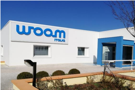
Noci (BA), Via Tommaso Fiore, 15

Consulting srl con atto del Notaio Carino Roberto del 13.06.2019 di Monopoli, repertorio n. 142110 ed avente effetto giuridico dal 01/07/2019 ha incorporato attraverso fusione la società "Golden Service S.r.l.". Dal 23/09/2019 Consulting srl ha cambiato il nome in WOOM ITALIA S.R.L. E' una società di formazione, consulenza e servizi per l'imprenditorialità, nonché Ente accreditato per la formazione in Puglia, con sede legale a Noci in Via T. Fiore, 15. Succede a titolo universale in tutti i rapporti giuridici della incorporata, ed è quindi autorizzata per i servizi al lavoro (Atto Dirigenziale n.1528 del 09/10/2017 codice pratica S7YHPT5 per la sede di Noci e Atto Dirigenziale n.538 del 28/09/2018 per l'estensione alla sede di Lecce).